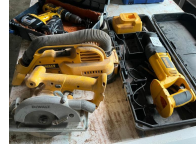
Lot DEWALT, scie sabre, scie circulaire, aspirateur et perceuse