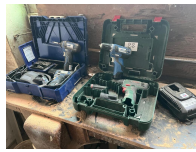
Lot de 3 perceuses BERNER usagées et chargeur et autre perceuse BOSCH