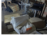
Lot de 5 étagères en plastique et lot de 12 tabourets de bar en plastique pied bois, lot d'une dizaine de pieds de table diverses tailles et plateaux rond en 80cm principalement