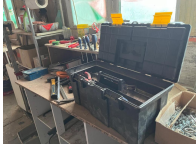
Parties d'outils à main et caisse à outils et lot de serre joints diverses tailles