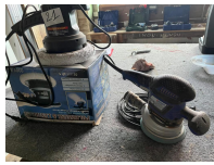
Lot ponceuse BERNER et polisseuse GOOD BUDY