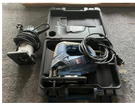
Lot scie sauteuse MAC ENZIE et affleureuse BOSCH