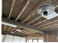
Lot de 2 lampes chauffantes électriques